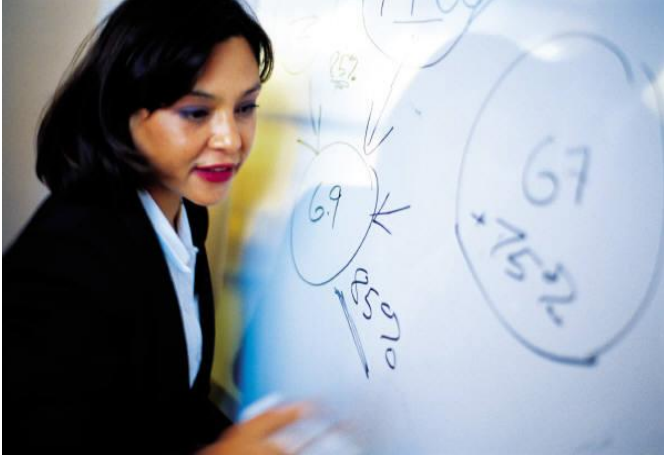
[atkelta iš 1 psl.]

Neringos (4,5 proc.), Kretingos r. (5,6 proc.) ir Skuodo r. (5,7 proc.) savivaldybėse.