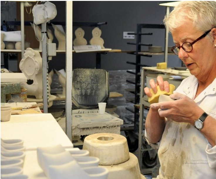
[atkelta iš 2 psl.]

automobilių vairuotojais, administratoriais, statybininkais.